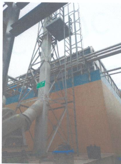
污水处理站排气筒出口 06#