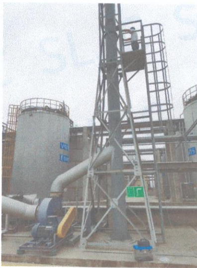
罐区一排气筒出口 04#