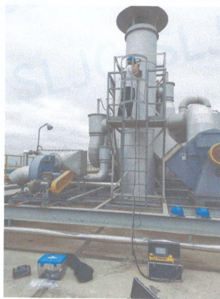
车间一排气筒出口 01#