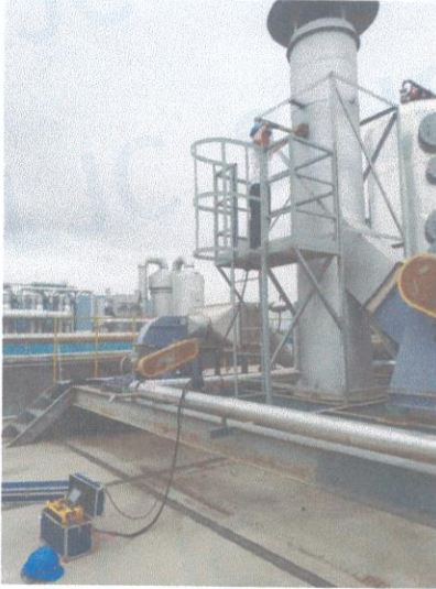
车间二排气筒出口 02#