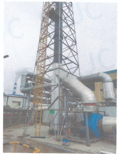
RTO 排气筒出口 05#